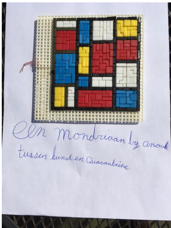
Tussen kunst en quarantaine: een Mondriaan door Anouk.